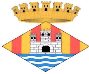
Consell Insular d'Eivissa.